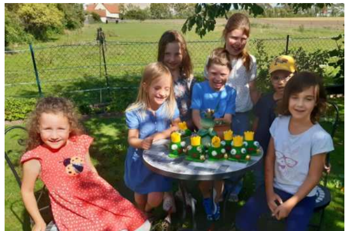
Text und Fotos: Margit Keller

Selbstverständlich durfte dabei auch eine leckere Brotzeit und ein Eis nicht fehlen. Am Ende präsentierten dann alle Teilnehmer stolz ihre Werke den Eltern.